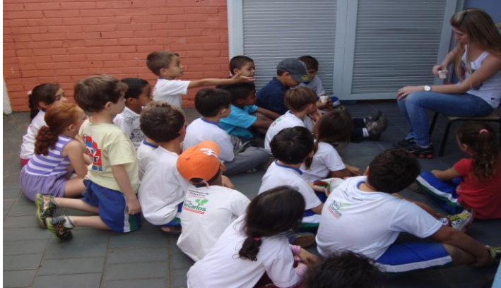
Figura 1- Roda de conversa

O primeiro momento do projeto foi o levantamento dos conhecimentos prévios dos alunos sobre por que nossos dentes caem ( figura1 ) em uma roda de conversa.