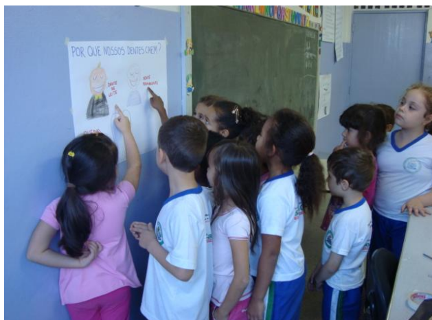
Figura 5: Exposição dos trabalhos

Assim que voltaram da conversa com o dentista discutimos a questão inicial, no intuito de verificar se houve compreensão. E para finalizar os alunos compartilharam seus registros que permearam todo o trabalho com os demais colegas.