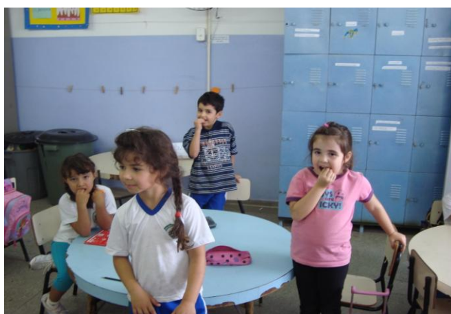
Figura 3: realização do experimento

Assim que todos ( figura 4 ) degustaram a cenoura pedimos que verificassem se seus dentes estavam normais ou não.