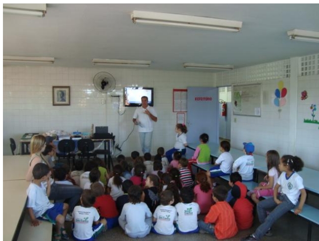
Figura 4: Conversa com o dentista

Todos concordaram com a sugestão do colega e o dentista foi convidado a discutir com os alunos e juntos responderem a questão estudada.